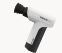
NIPLUX FASCIALAX MINI 2S 筋膜用小型ハンディガン

そんな皆様の声にお応えするため、 顔にも使える丁度いい「パワー」と「軽さ」を兼ね備えた 「FASCIALAX MINI 2S」が生まれました。